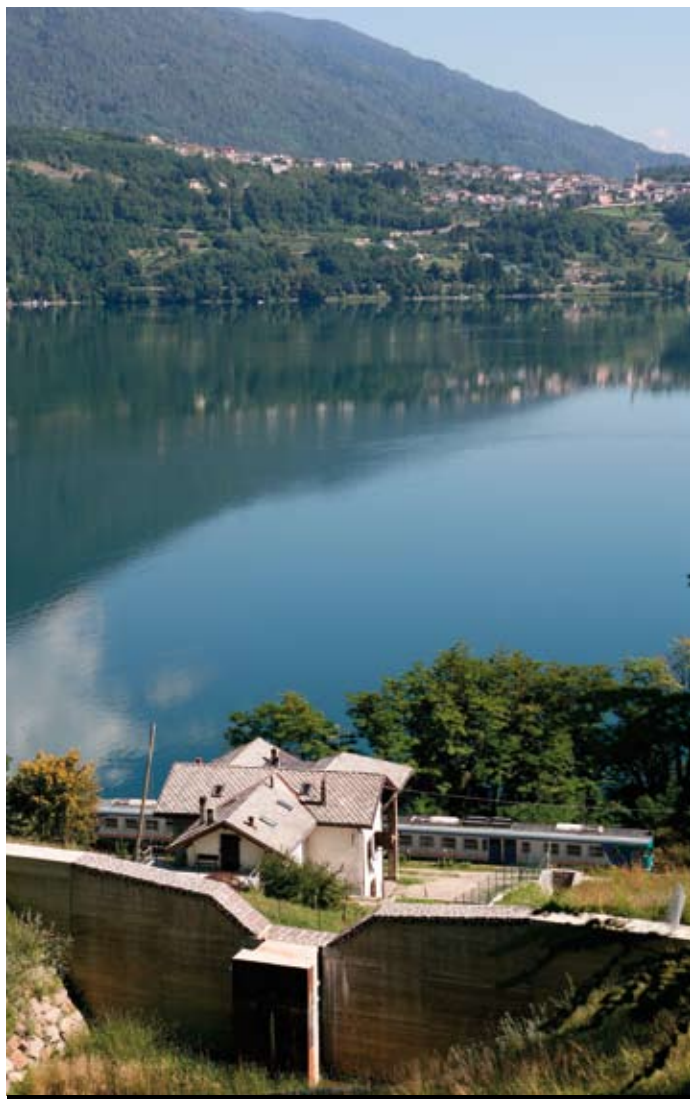
FOTO Briglia di trattenuta sul rio Sambugar (Comune di Bosentino) per la messa in sicurezza di un'abitazione, della strada provinciale e della ferrovia della Valsugana.

Nelle tabelle che seguono si riporta la suddivisione dei costi dei principali interventi realizzati nei Comuni trentini dai Servizi Opere idrauliche, Sistemazione montana e Bacini montani, nell'arco dell'anno, suddivise in base all'ambito territoriale dei principali bacini idrografici..